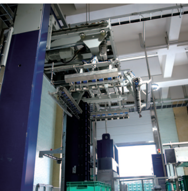
Depalletizer Palletizer 디팔렛타이저 팔렛타이저