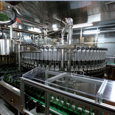
Filler&Capper 주입기 및 캡핑기