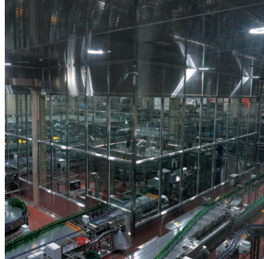
Bottle conveyor 병컨베어