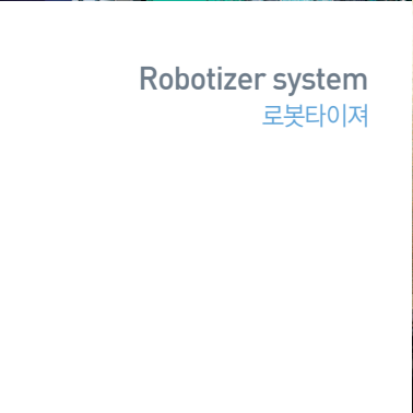
Robotizer system 로봇타이저