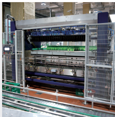
Un Packer Case Packer 언팩카 케이스팩카